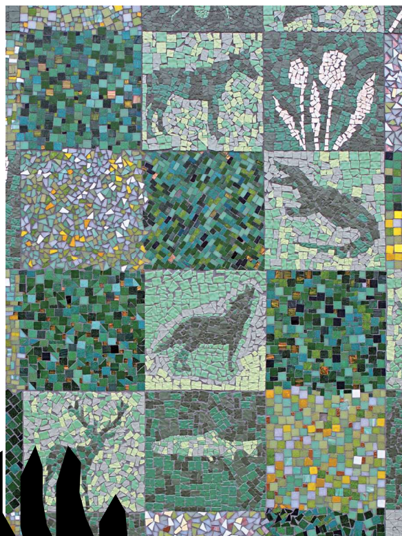
ミスズアート・スタジオ 多治見市根本交流センター外壁(部分)、2013年