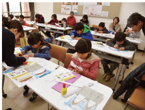
ワークショップの様子(2019年1月)