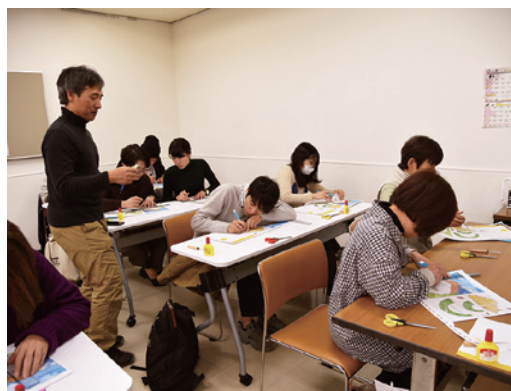
ワークショップの様子(2019年1月)

昨年度大好評だった、折り紙建築のモザイクタイルミュージアムを作ってみよう! 「秘密」がいっぱいの館内の特別ツアーも開催します! ※特別ツアーは15:00~16:00(予定)。大人は観覧料が必要です。